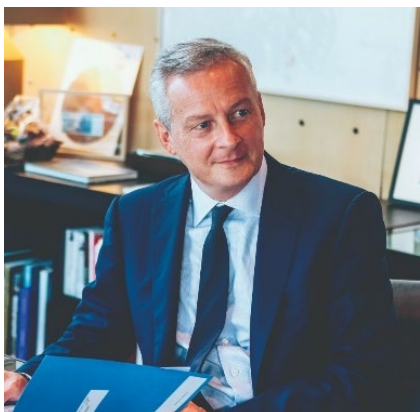
Bruno Le Maire, ministre de l'Économie, des Finances et de la Relance.

Les entreprises et leurs salariés sont le cœur battant de l'économie française. La décision de les protéger « quoi qu'il en coûte » était le seul choix responsable.