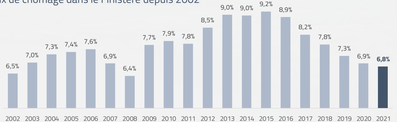
Taux de chômage dans le Finistère depuis 2002

DE NOMBREUX SECTEURS FRAGILISÉS PAR LES DIFFICULTÉS DE RECRUTEMENT